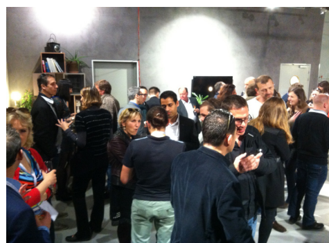
Soirée Get together : 50 € HT