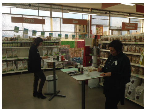
Tasting and Testing Tour : 200 € HT