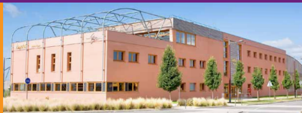
© Serge Chapuis, photographe / Denis Dessus, SORHA Architectes

ADRESSE Bâtiment INEED Quartier Rovaltain TGV 1 rue Marc Seguin 26300 ALIXAN (France) www.ineedra.org